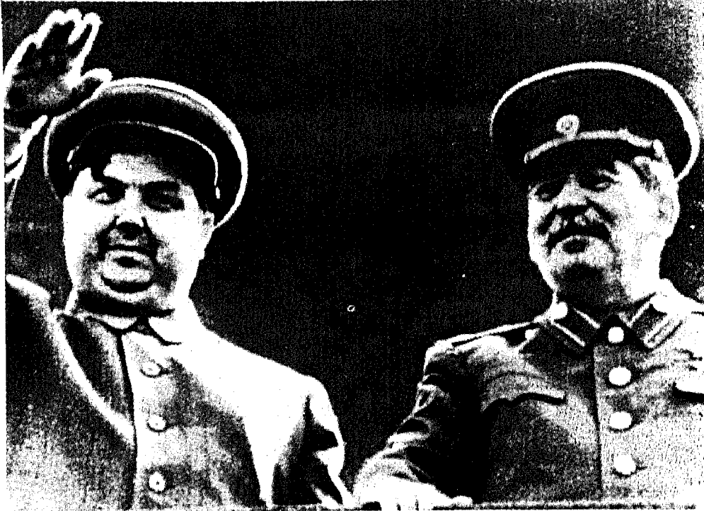
القائد والخليفة: ستالين وإلى جانبه مالينكوف على شرفة الكرملين عام ١٩٤٩.